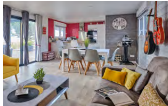
Photo non contractuelle - Fauteuils et accessoires en option.